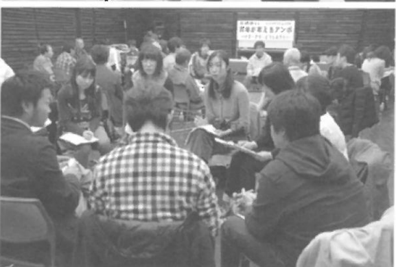
写真はすべて2010年日本平和大会in佐世保