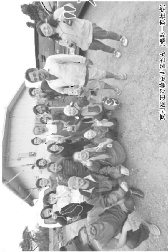
東村高江で暮らす皆さん